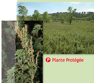
Armoise de Molinier au Lac Gavoty (Flassans)